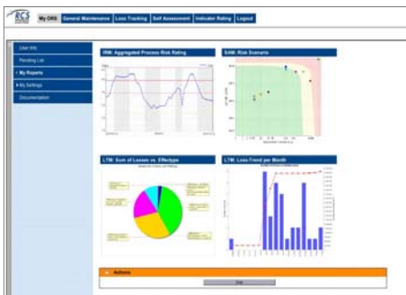
OpRisk Suite Management Cockpit